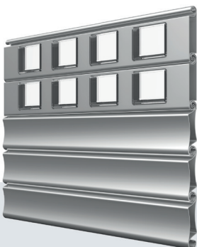
Profil AL / VZ 90 Profil AL / VZ 110 LP

Weitere Kombinationsmöglichkeiten auf Anfrage.